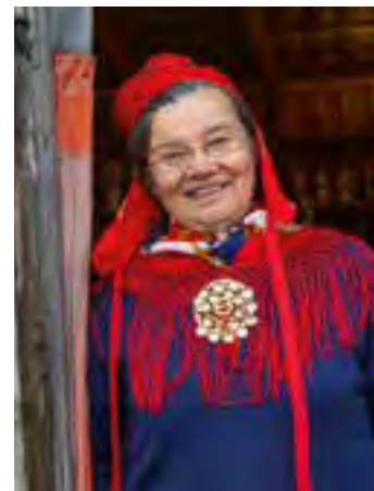
Les Sami sont fiers de leur culture fascinante.