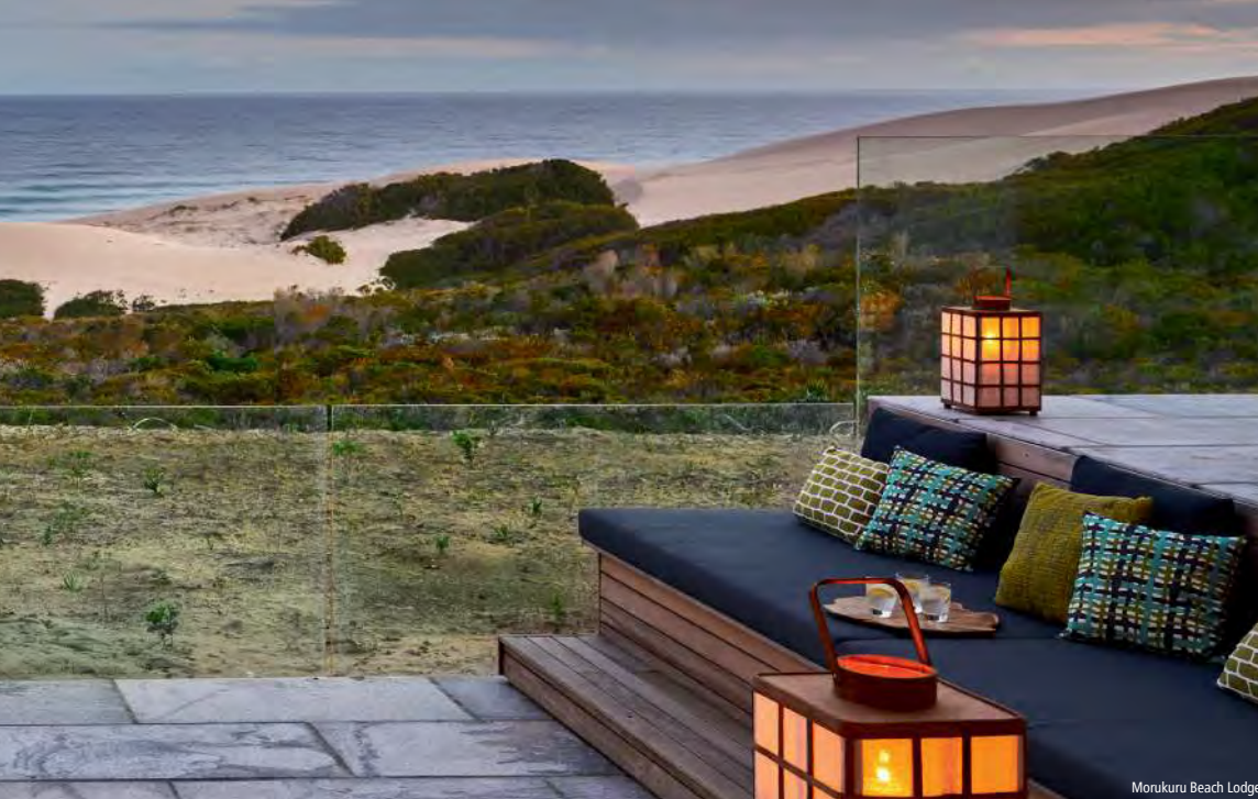
Morokuru Beach Lodge

être observées. Les safaris en véhicule tout-terrain ouvert sont accompagnés par un ranger local et ont lieu deux fois par jour. Hébergement au Phinda Vlei ou Rock Lodge o.s.