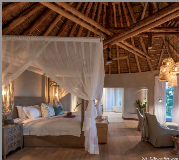
Dulini Collection River Lodge

Aujourd'hui, vous atteignez la magnifique région des vignobles et faites connaissance avec plusieurs grands crus sud-africains. Vous visi-