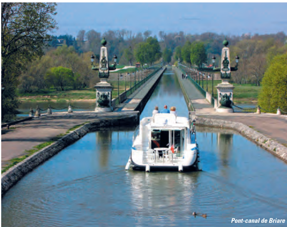
Pont-canal de Briare