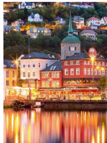
La ville hanséatique de Bergen dans la lumière du soir invite à la détente.