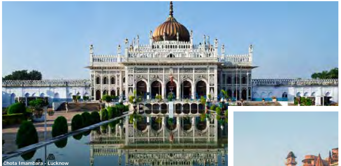
Chota Imbarā - Lucknow

Uttar Pradesh Madhya Pradesh Rajasthan 14 jours / 13 nuits