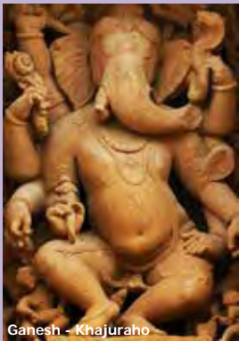
Ganesh - Khajuraho

Le Saviez-vous ? Les temples de Khajuraho, édifés au 10 et 11 e siècles sous la dynastie Chandela, sont connus à travers le monde pour leurs fines sculptures aux positions suggestives, particulièrement bien conservées. Souvent surnommés « temples érotiques », ils contrastent avec l'image assez prude de l'Inde d'aujourd'hui.