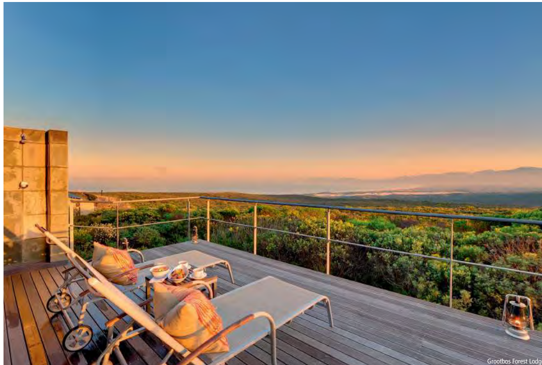
Grootbos Forest Lodge