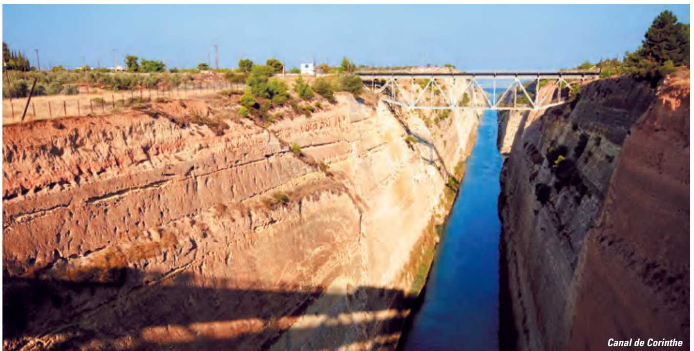
Canal de Corinthe

Débarquement après le petit déjeuner. Transfert en ville d'Athènes et temps libre, puis transfert à l'aéroport et envol pour la Suisse.