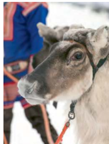
Le Finnmark est caractérisé par les Sami et les rennes.