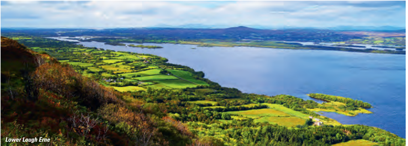
Lower Lough Erne