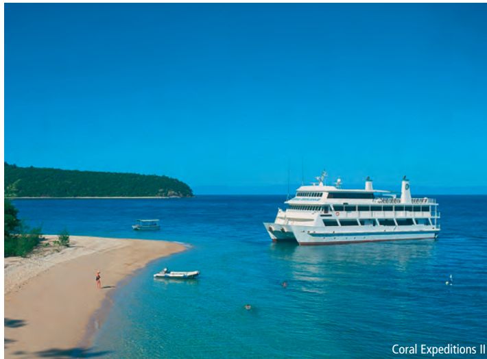
Coral Expeditions II

Avant d'entamer le trajet de retour pour Cairns, vous avez la possibilité de découvrir Fitzroy Island lors d'une courte promenade. Les belles plages de sable blanc invitent à la baignade et au snorkeling. Après le repas de midi, départ pour Cairns où l'arrivée est prévue vers 13h30.