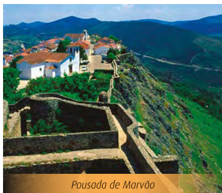
Pousada de Marvão

Départ pour la ville d'Évora, cité historique au cœur de l'Alentejo. Nous vous recommandons de visiter la vieille ville, inscrite au patrimoine mondial de l'humanité par l'UNESCO. En passant par ses ruelles étroites, vous visiterez les principaux monuments, tels que le temple romain de Diane, la cathédrale romano-gothique, l'église de São Francisco et sa chapelle, ainsi que l'université. La visite vous permettra également d'admirer toute la variété de l'artisanat de la région de l'Alentejo (objets en liège, céramique et cuivre, notamment). Vous pourrez explorer librement la ville et profiter pour déguster le vin local et goûter le fromage et l'huile d'olive de cette région. Une nuit dans la Pousada historique de Lóios.